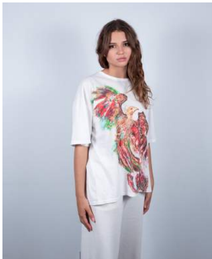
Louna mesure 1,78 m - Taille S Louna is 1,78 m tall - Size S