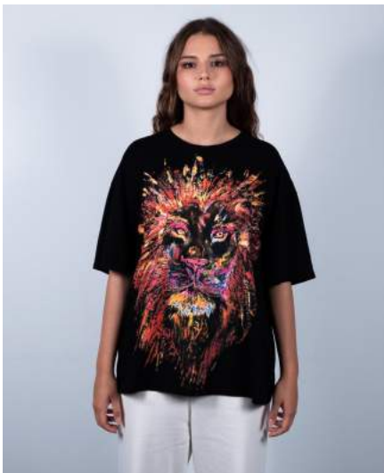
Louna mesure 1,78 m - Taille S Louna is 1,78 m tall - Size S