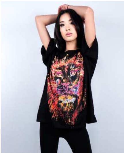
Vara mesure 1,58 m - Taille S Vara is 1,58 m tall - Size S