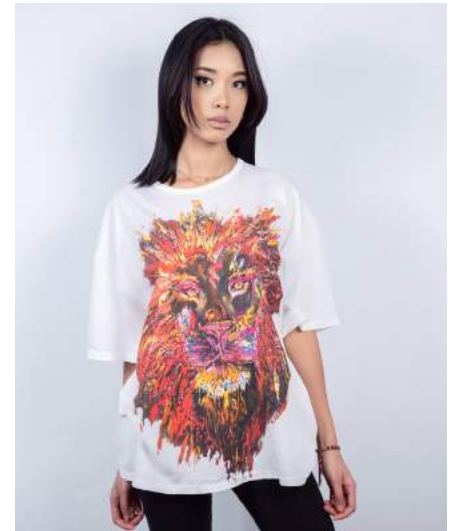
Vara mesure 1,58 m - Taille S Vara is 1,58 m tall - Size S