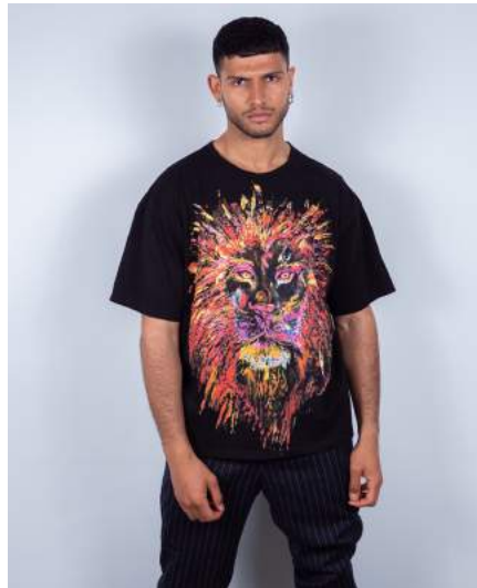
Chams mesure 1,85 m - Taille M Chams is 1,85 m tall - Size M