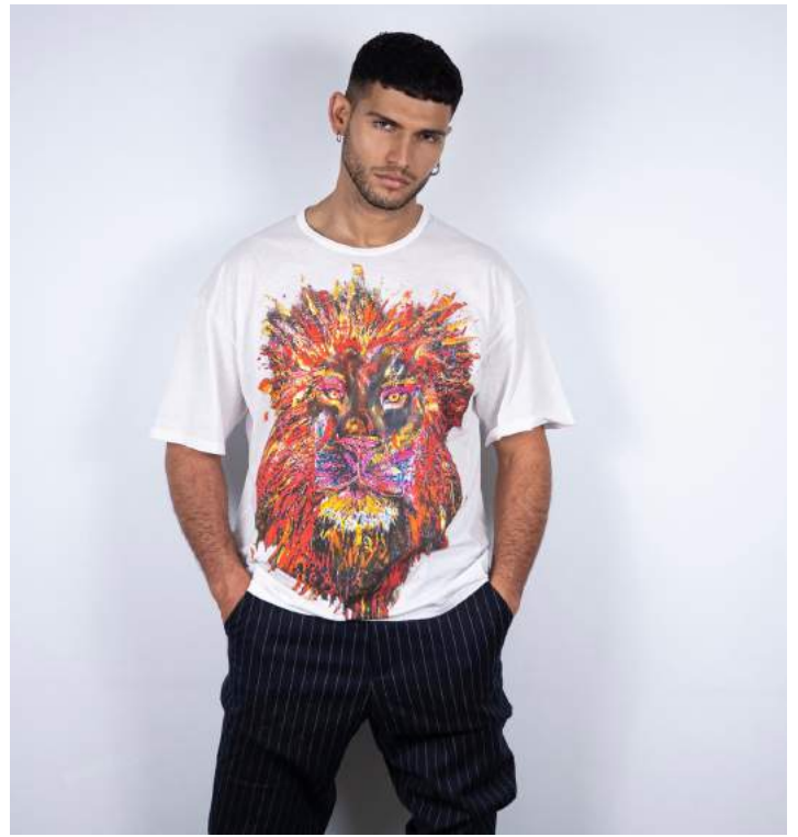
Chams mesure 1,85 m - Taille M Chams is 1,85 m tall - Size M