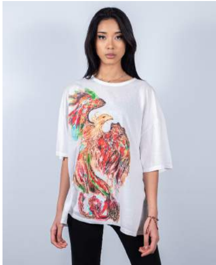
Vara mesure 1,58 m - Taille S Vara is 1,58 m tall - Size S

Couleur / Colour : Ecrú blanc / Ecrú White